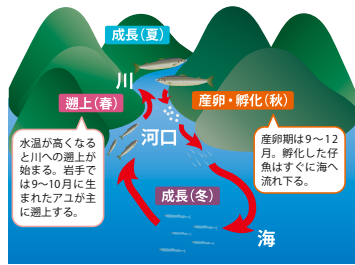
図1: 一般的なアユの一生

アユは、秋から冬に川でふ化して海へ流下し、海で半年ほど成長した後、翌年の春に川に遡上して、さらに成長し繁殖する「両側回遊魚」で、一年で一生涯を終える「年魚」です(図1)。私の研究は、二〇一一年の津波の後に、アユの生態がどのように変化したかを明らかにすることを目的としています。津波が発生した三月は、アユの仔稚魚が海にいる時期であり、直接の影響があったと予想できます。アユの生態は、魚の頭の中にある「耳石」を分析することで調べることができます。耳石は炭酸カルシウムの小さな結晶で、体の成長に伴って大きくなります。アユの耳石には一日に一本、木の年輪のような輪が作られるため、これを数えることでふ化した日わかります(図2)。さらに、海で高く、川で低くなるストロンチウムとカルシウムの比(Sr:Ca比)を調べることで、海で過